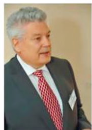
Бойко Анатолій Володимирович

Заведуючий кафедрою (1989–2003), академик Академії наук вищої школи України (1993), академик Інженерної Академії України. Нагороджен орденем Ярослава Мудрого в області науки і техніки от Президиума Академії наук вищої школи України (1997). С 1990 г. – член совета НАНУ «Научные основы тепловых машин», с 1994 г. – председатель научного отделения Академії наук вищої школи України «Енергетика і енергосбереження». Автор свыше 180 печатных трудов, в том числе двух монографий.