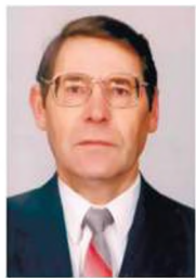
Слитенко Аркадій Федорович (1938 – 2003)

Заведуючий кафедрою (1989–2003), академик Академії наук вищої школи України (1993), академик Інженерної Академії України. Нагороджен орденем Ярослава Мудрого в області науки і техніки от Президиума Академії наук вищої школи України (1997). С 1990 г. – член совета НАНУ «Научные основы тепловых машин», с 1994 г. – председатель научного отделения Академії наук вищої школи України «Енергетика і енергосбереження». Автор свыше 180 печатных трудов, в том числе двух монографий.